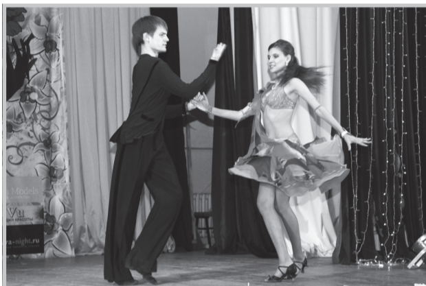
В ритме танца

На заключительном этапе университетские красавицы должны были продефилировать по сцене в платье, сделанном своими руками. Материалы использовались самые разные – от обычных тканей до газет и полиэти-