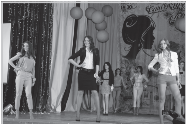
В офисном стиле

Этого дня ждали все: и прекрасные участницы конкурса, и их поклонники, принадлежащие к сильной половине человечества. И вот, наконец, 23 мая в концертном зале 1-го корпуса прошел финал конкурса «Мисс СамГТУ 2013», в котором приняли участие десять самых красивых девушек политеха.