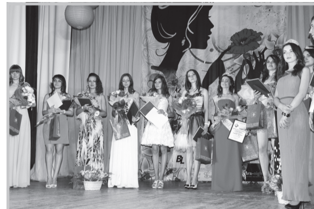
Самые красивые девушки политеха